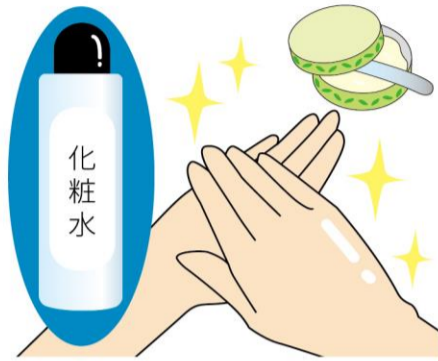
お休み前は、ハンドクリームの前に化粧水などをつけてから塗ると、保湿力がアップします♪

美しい手を保つためには、保湿が大切。手洗いをした後はまめにハンドクリームをつけることをおすすめします。ハンドクリームの説明書きにある量を、手のひらをすり合わせて温めると伸びが良くなります。手の甲をおさえながら全体に塗りまします。指と指の間は両手を組んで上下に滑らせるようにして塗り、親指は意外と完全に塗れていないこともあるので、優しく塗りましょう。爪も親指や人差し指で軽くすり込むようにします。