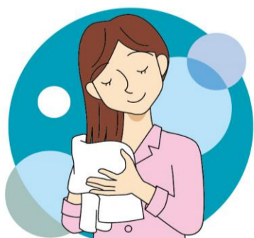
ヘアオイルや洗い流さないトリートメントは入浴後の髪の水分を優しく、しっかりとすることで効果に違いが出ます！

ちなみに、トリートメントとコンディショナーの違いってご存じですか？トリートメントは髪に栄養を与え、修復してくれるもの。コンディショナーは、髪の表面を保護してく